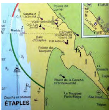
Baai van Etaples

Volgens de nieuwe Cruising Almanac kun je de baai van Etaples binnenvaren van 2 uur voor tot 2 uur na hoogwater, al varen wij zelf het liefst met de vloedstroom naar binnen. Als je dan vast komt te zitten kom je zo weer los. Bij vallend water moet je minimaal 8 uur wachten