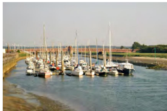
Jachthaven Etaples bij laag water

De tonnen zijn niet groot maar prima te zien en het eerste paar zijn lichtboeien. We meanderen een beetje door de baai. We loden nergens minder diepte dan 1,80 m. en dan steken we ook nog stukjes af.