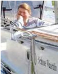
Schone Waardin is net wakker