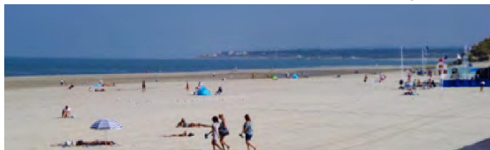
Overzicht van de riviermonding vanuit Paris Touquet Plage