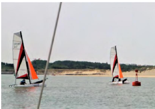
Zeilschool rond de tonnen

Het is gezellig druk met catamarans, zeekano's en open bootjes van de zeilschool.