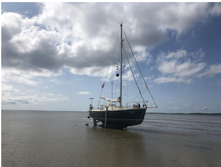
3 Onder de Richel, augustus 2021

En helaas, als ik mijn boot om 13.15 aan de grond gezet heb, kom ik s'avonds net een paar cm te kort om weer te drijven. Dat wordt dus een onbedoeld nachtje op het Wad. Wil je die verrassing voorkomen raadpleeg dan kort tevoren Quicktide nog even.