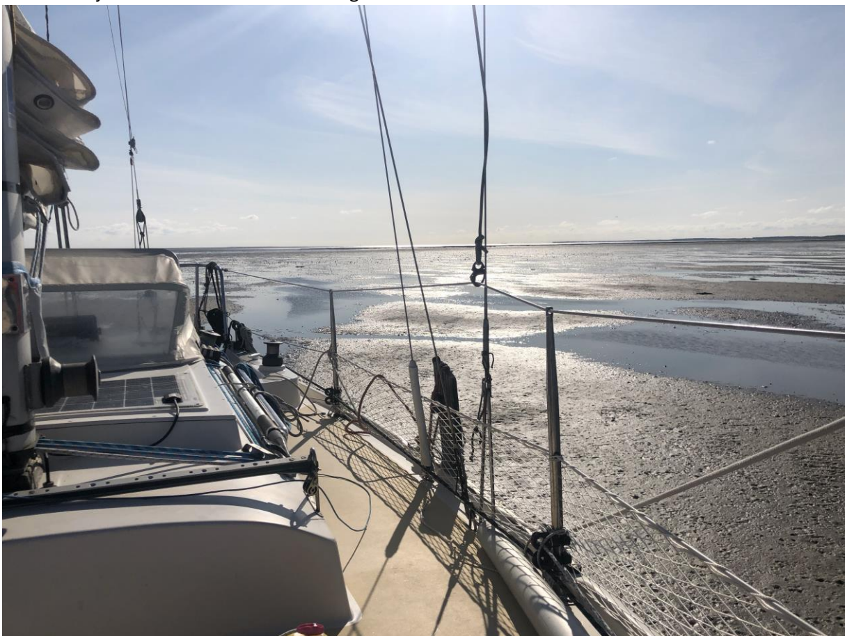
7 Waar eerst nog overal water was, is nu zand rondom de boot (Richel)