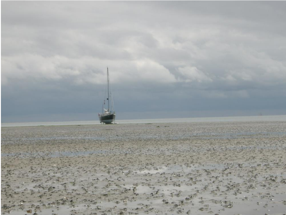
10 Op de Koffiebonenplaat (2005)