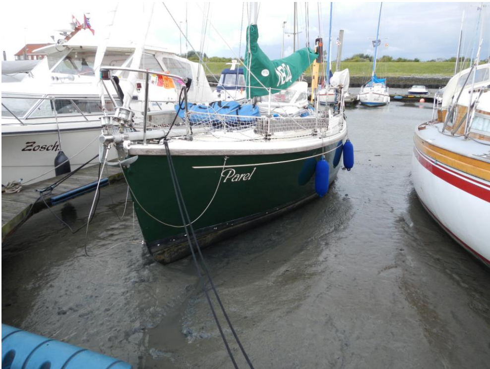
11 In de Duitse modder op Borkum