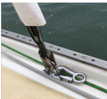
6 Aan de wandputting wordt een oog gezet om de takel te kunnen spannen