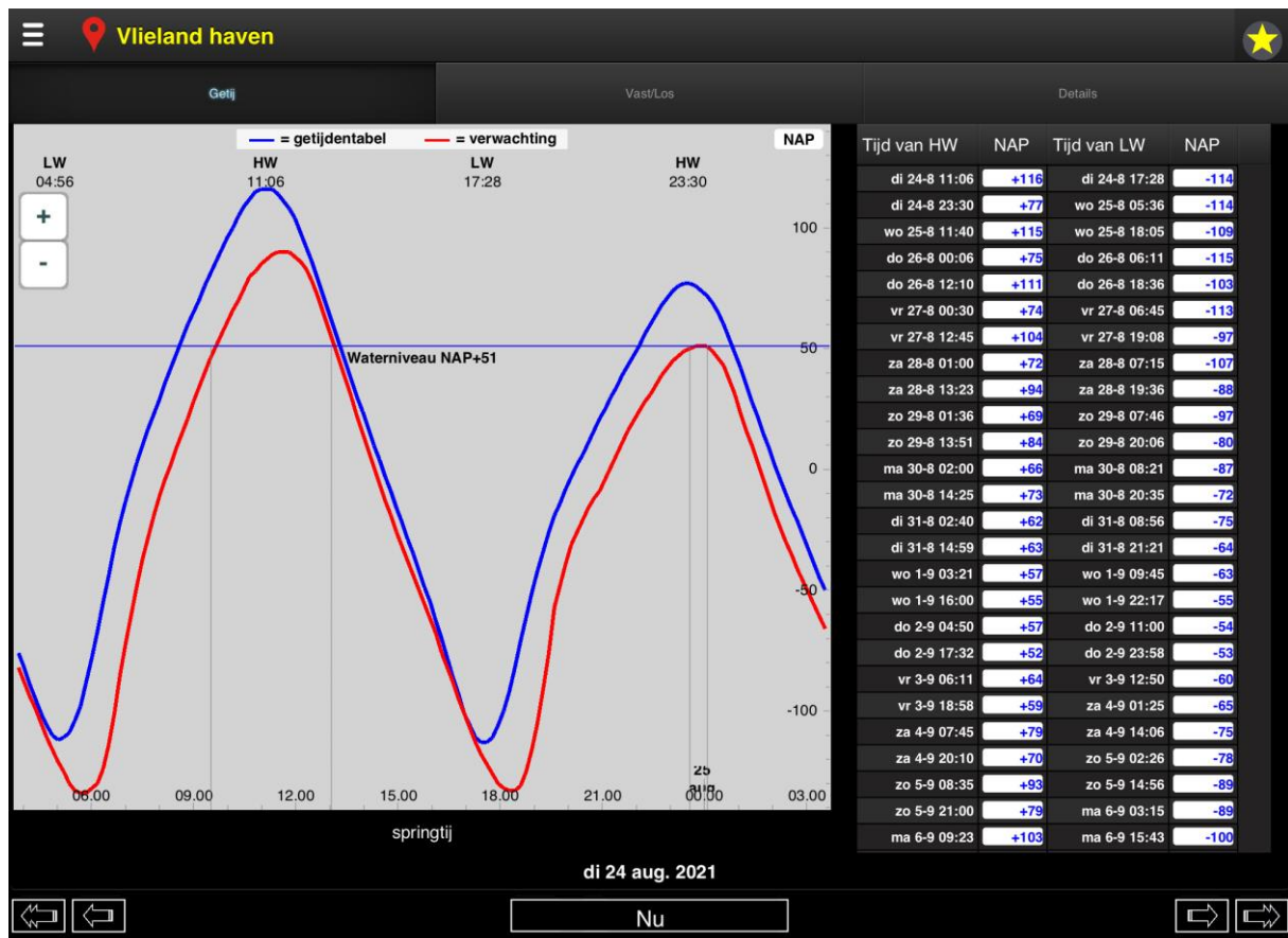
2 Quicktide, nu met de afwaai effecten

De te verwachten op- of afwaai wordt ook door Quicktide gegeven maar uiteraard pas 1-2 dagen van te voren. In het geval van 24 augustus 2021 ziet die bijgestelde verwachting er als volgt uit