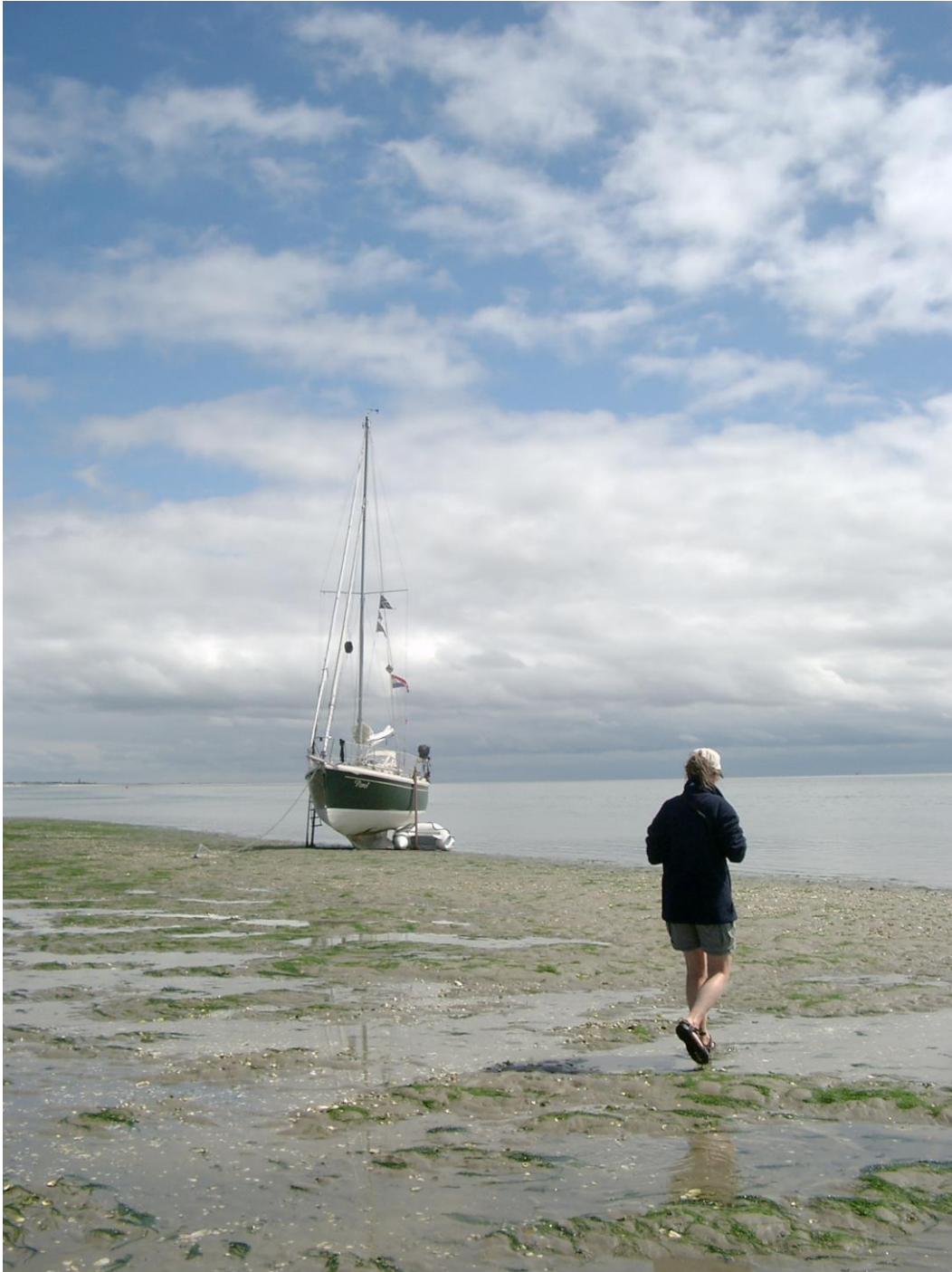
8 Tijd voor een wandeling. (Koffiebonenplaat)

Is de bodem slik, dan is wandelen minder leuk, je kunt nog wel even rond de boot lopen. Pas op dat je niet uitglijdt en languit in de drek terecht komt. Afhankelijk van hoeveel slik kan het nog mogelijk zijn een anker uit te lopen. Is de bodem dunne modder dan blijf je gewoon gezellig aan boord.