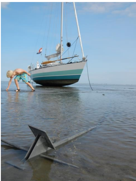
9 Kokkels zoeken op de Vlakte van Kerken