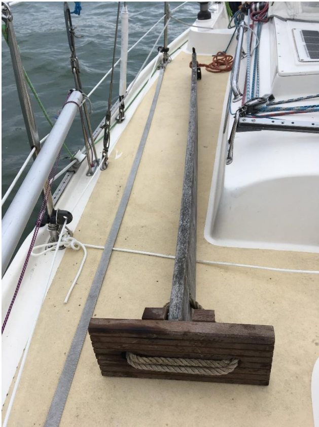
5 De Wadpoot wordt aan dek voorbereid.