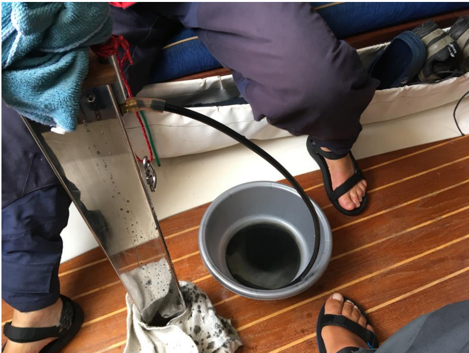
12 Via een overloop en een slangetje komt de prut in een teiltje