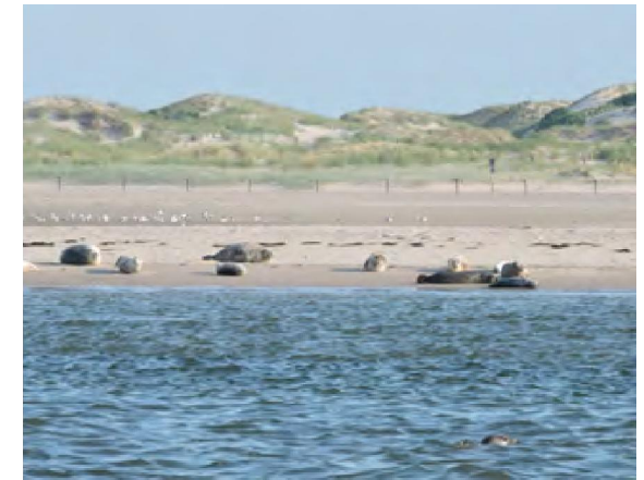
Zeehonden op de Oostpunt van Norderney

Na het wantij moeten we voor Baltrum een eindje naar buiten voor we in de geul weer naar binnen kunnen varen.