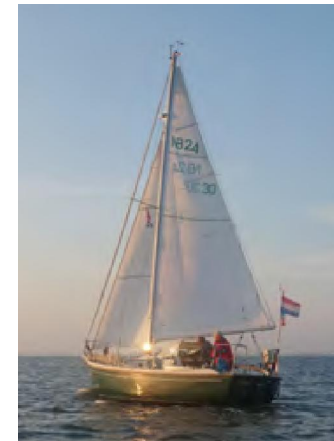
Vertrek om 05.30 uit Norderney

Om 04.30 uur gaat de wekker. Joosje, de scheepshond, moet uitgelaten, de boot aan kant, koffie en thee gezet en exact om 05.30 uur is zowel de Windroos als Parel klaar. Wij liggen wat weggedrukt in een hoek, wat door de iets gedraaide wind een beetje lagerwal blijkt te zijn. Na wat geknutsel