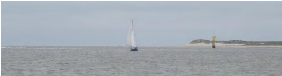
We passeren de aanloop naar Spiekeroog. We gaan nog door naar Wangeroog