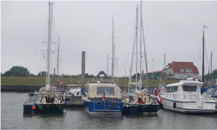
Op Langeoog wachten we op het volgende Hoog Water