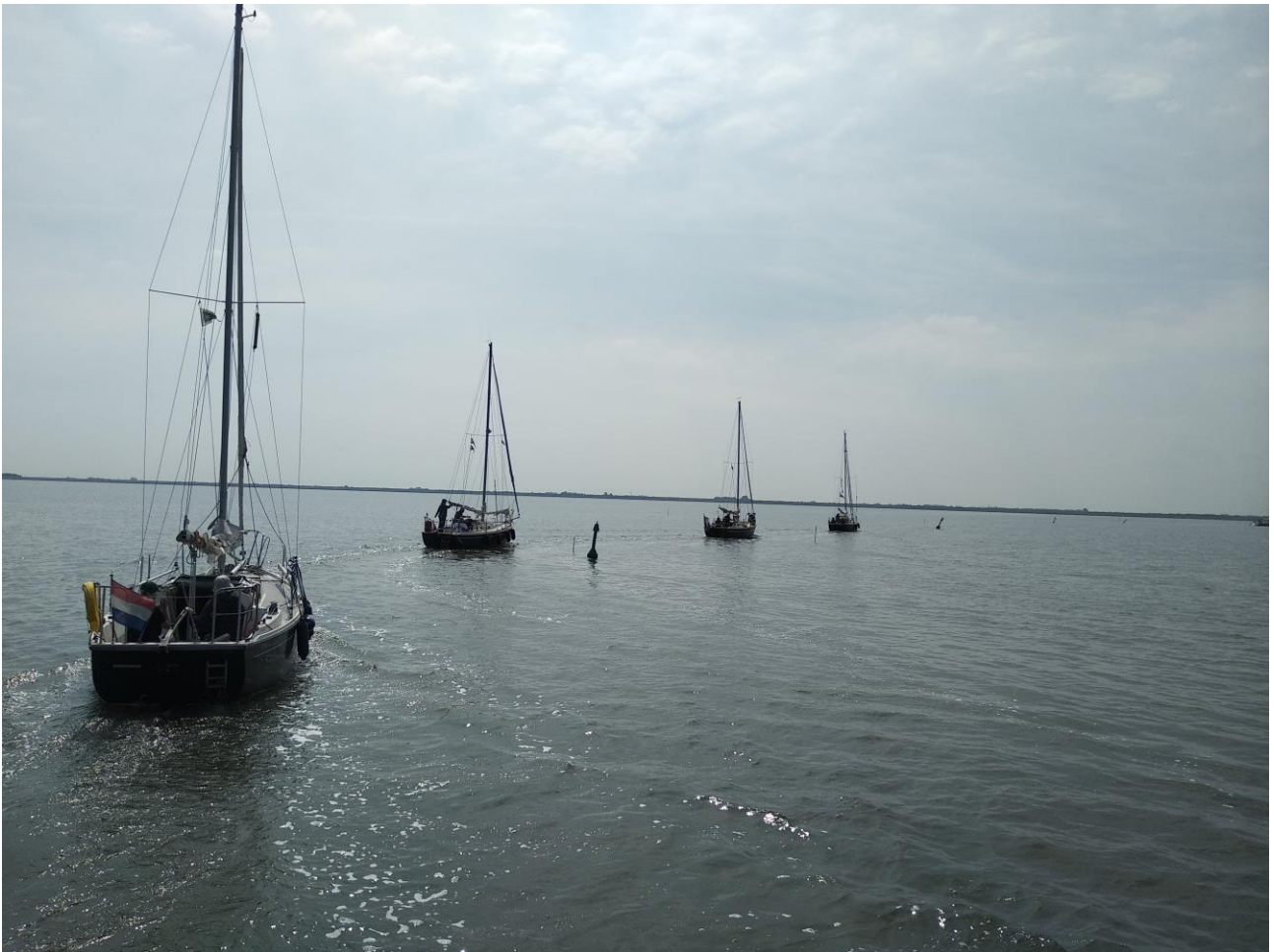
6 De aanloop naar Noordpolderzijl

Met een scherpe draai tegen de stroom, aan het einde van de geul komen we one by one aan de kant en worden we opgevangen door een jonge gebruide Tarzan.