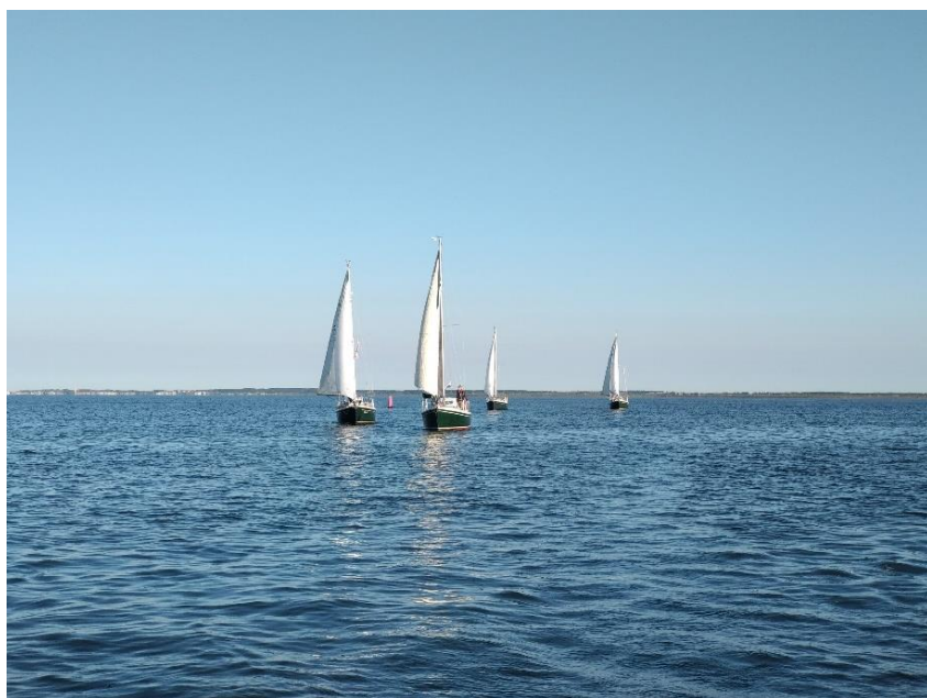
3 Naar het Oosterom