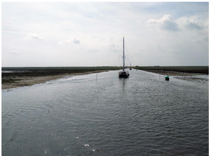
7 Tussen de kwelders