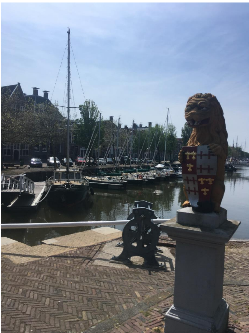
1 In Harlingen waakt de leeuw over de North Beach vloot

Bedoeling 8.15 voor en achter, 5 voor half 9 brug.