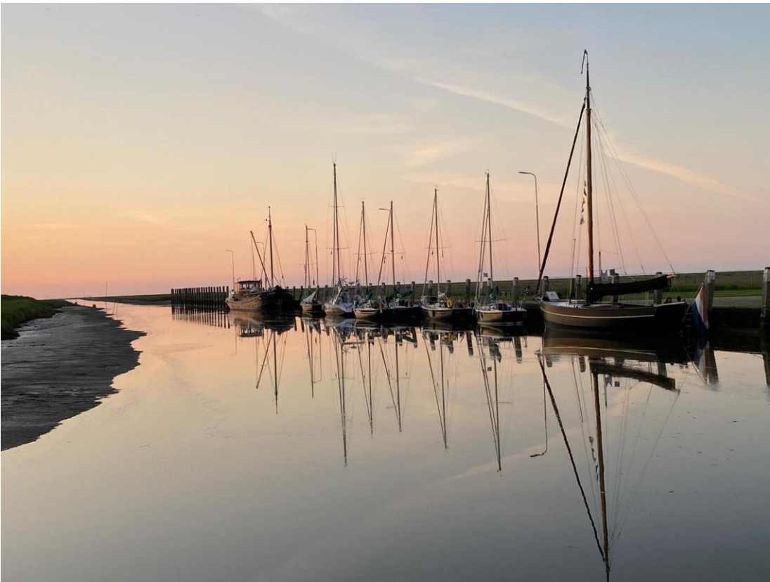
9 Avondstemming Noordpolderzijl