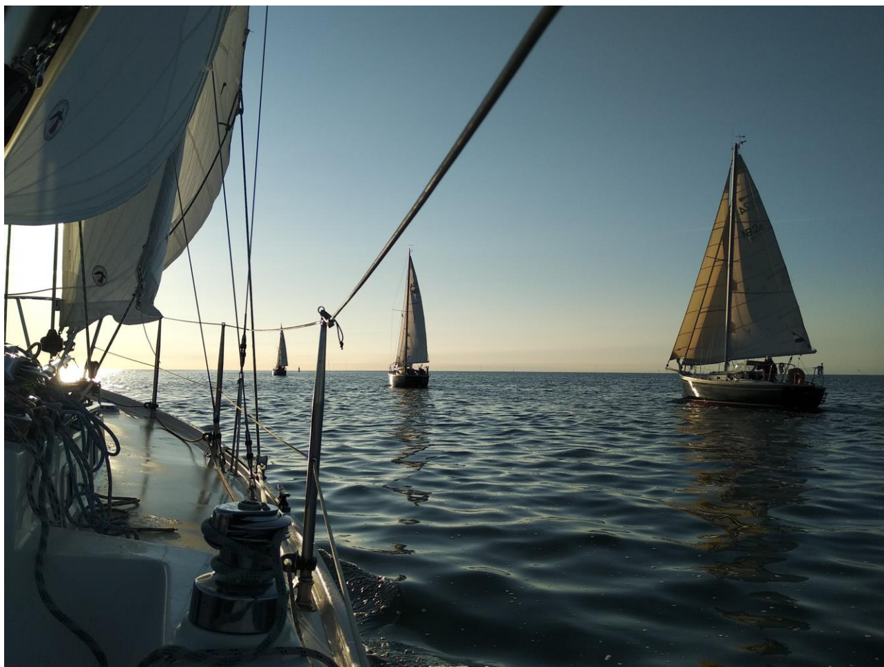
2 Vroeg vertrek van Terschelling

3e palaver, de schipper van de dag zit bij mij aan boord. Het zal een onverstoorbare zeildag worden. Dankzij wind en stroom.