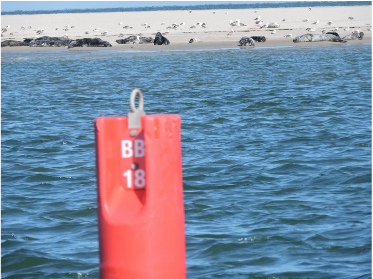
4 Zeehonden in de Blauwe Balg

4e palaver, de IJsvink, Ben en Joke die meedelen niet mee te gaan naar Noordpolderzijl en in Lauwersoog ons flottielje gaan verlaten.