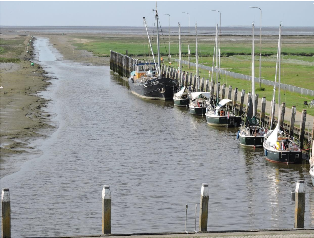
8 De bijna droogvallende haven van Noordpolderzijl