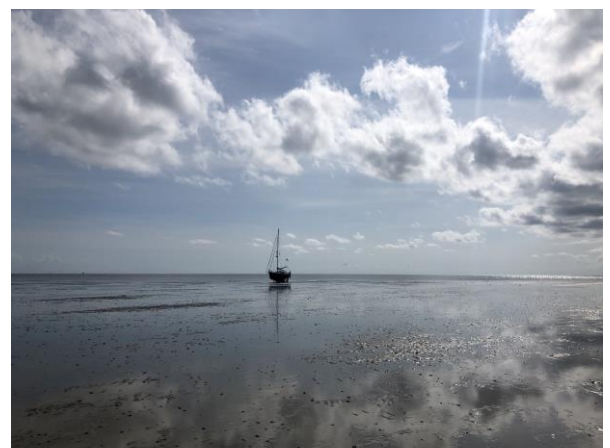
1 Parel drooggevalen bij de Richel